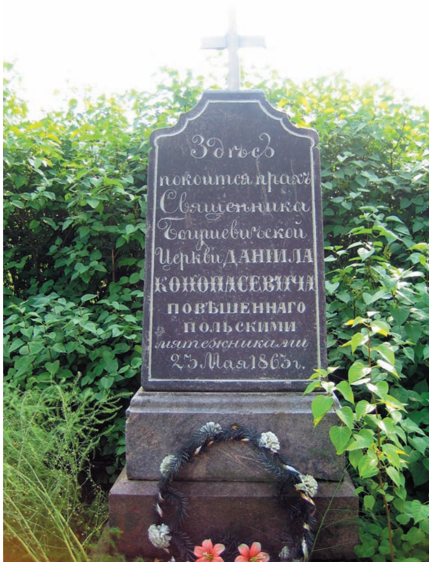
Вид восстановленного памятника на могиле священника Даниила Конопасевича (фото 2005 г.)