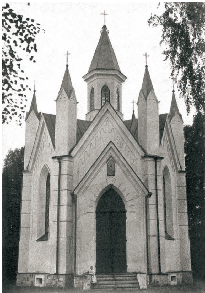
Храм в честь святого пророка Даниила, переделанный и освященный в 1869 г. из католического костела (фото XIX в.)