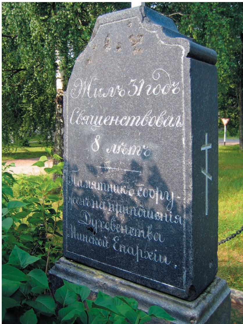
Вид памятника на могиле священника Даниила Конопасевича с обратной стороны (фото 2005 г.)