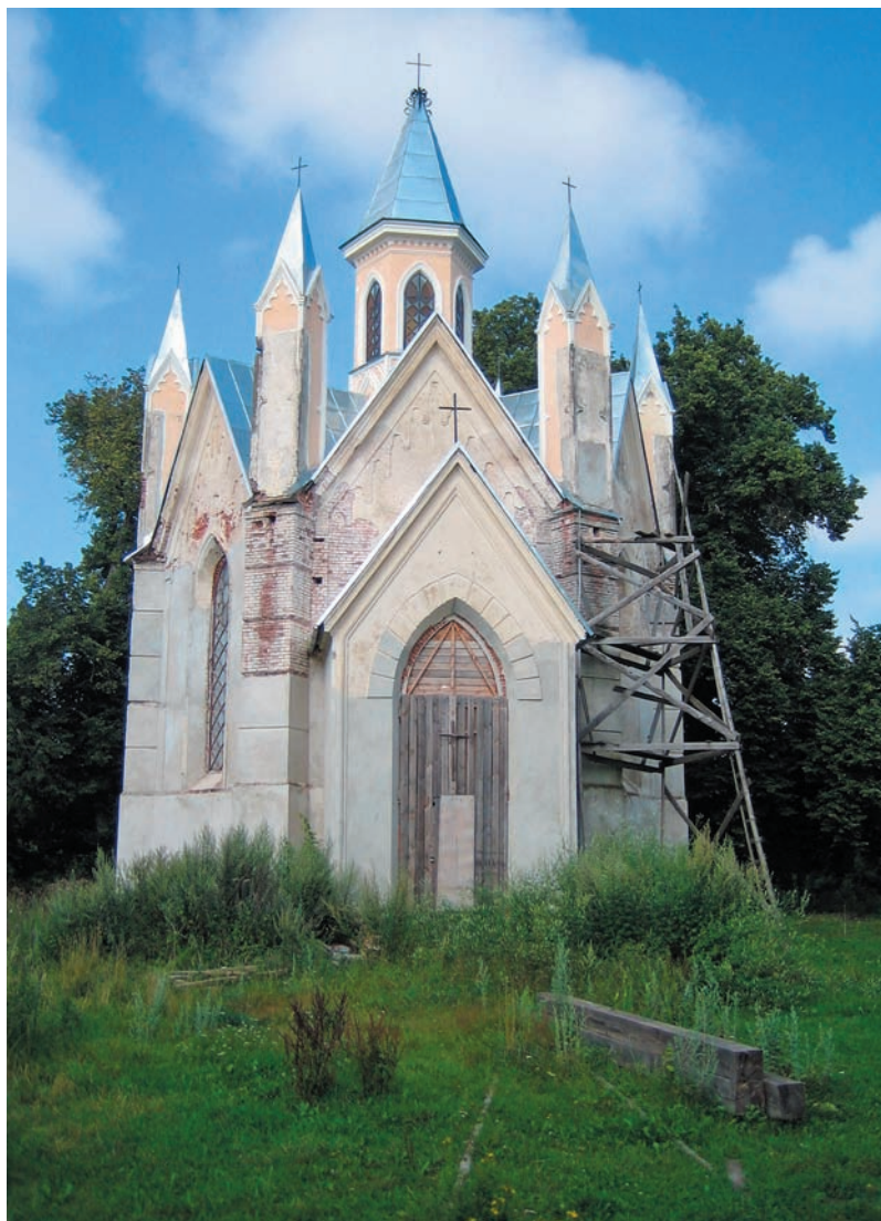
Бывший храм в честь святого пророка Даниила, переделанный и освященный в 1869 г. из католического костела. Ныне восстанавливается как католический храм (фото 2005 г.)