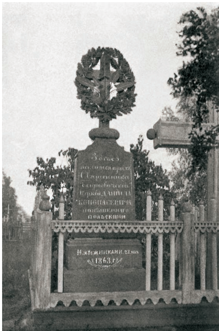
Памятник на могиле священника Даниила Конопасевича (фото начала XX в.). Справа, в ограде, виден крест над могилой священника Иоанна Рункевича, скончавшегося в 1874 г.