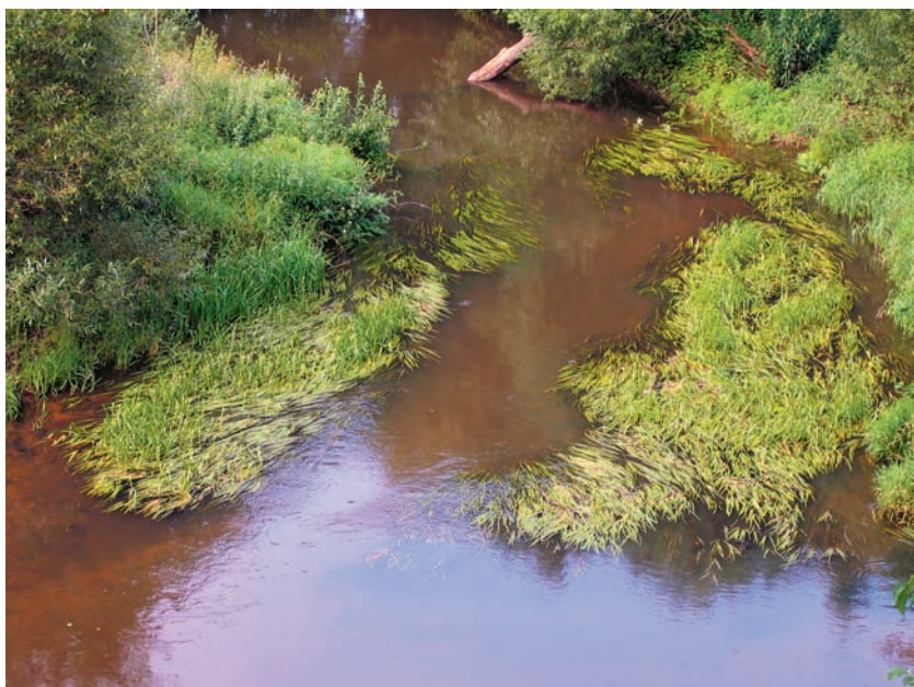
Вид на речку Уса с места, где располагалась усадьба помещиков Свенторжецких