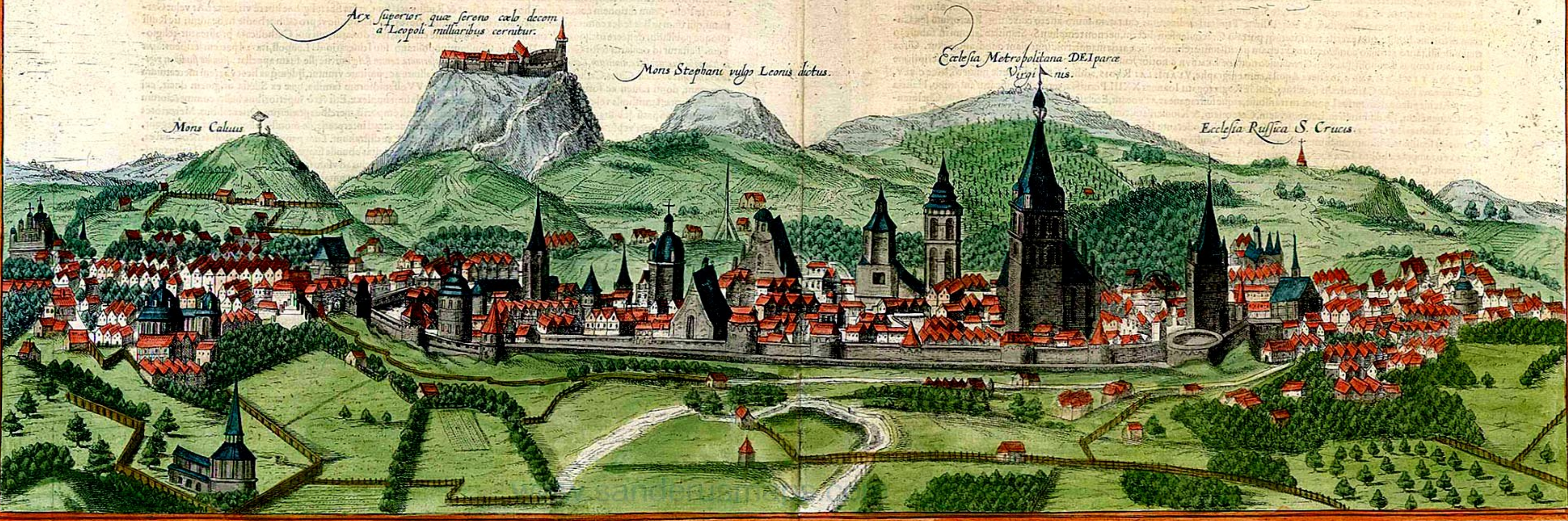
Arx superior quæ sereno celo decem a Leopoli milliaribus cernitur.