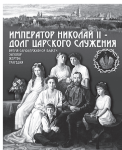
ИМПЕРАТОР НИКОЛАЙ II - ДОЛГ ЦАРСКОГО СЛУЖЕНИЯ

Продлится выставка до середины сентября.