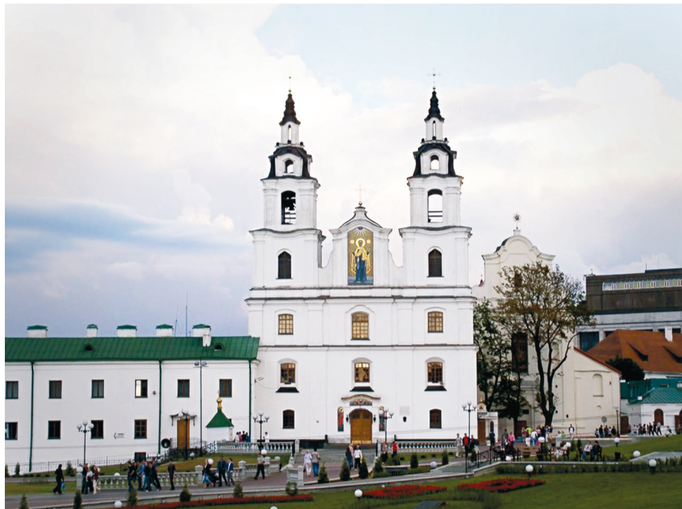
Минск, Свято-Духов кафедральный собор