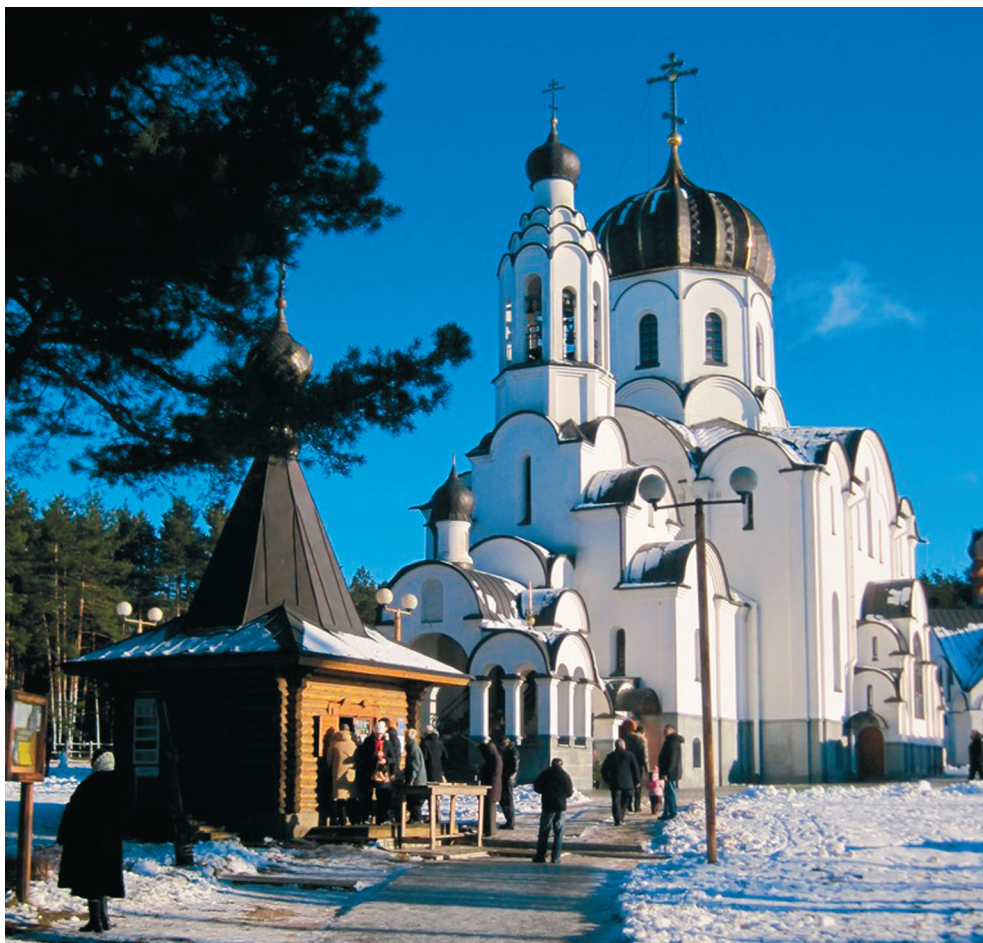
На фото: храм Рождества Христова в д. Стиклево. История этой церкви — на с. 4.